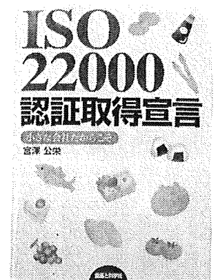
著書「ISO22000認証取得宣言」

食品業界専門の審査登録機関であるエコアオーデット(株)のISO22000の審査員登録機関(IRC)のISO22000の審査員として審査活動を実施している。2000年に雪印乳業の問題、翌年に異物混入の問題がありクレームの問題が一気に増えました。その後1、2年たっても異物混入の発見件数が元の数字には戻らないのです。消費者の中に、何か問題があったら保健所を持っていくもの、クレームとして扱うもの、